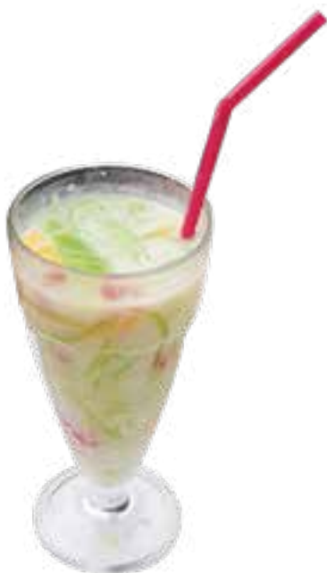
Trois couleurs au lait de coco 4,50€ 椰奶三色冰