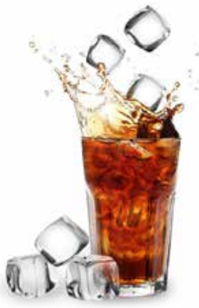
Thé glacé 3,00€ 冰茶